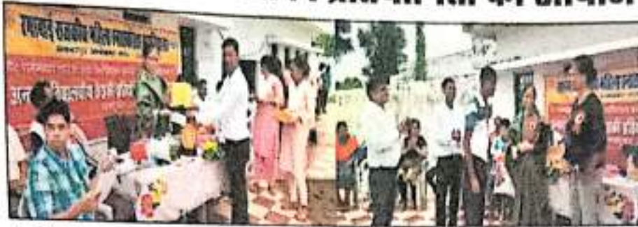
आनन्दी मेल सेनादल