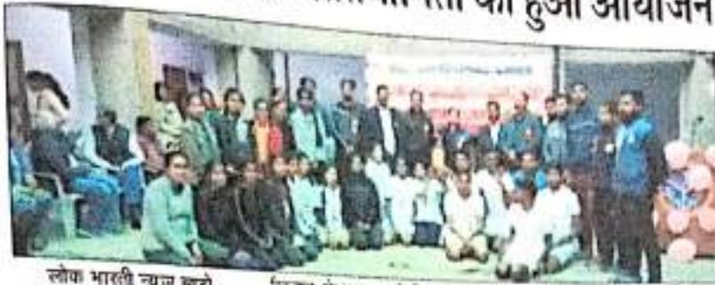
लोक भारती न्यूज ब्यूरो

अम्बेडकर नगर जिनपद पर स्थित भंगसरवार की रमाबाई राजकीय महिला स्नातकोत्तर महाविद्यालय अकबरपुर में दो दिवसीय अंतर महाविद्यालयी योगासन प्रतियोगिता का समापन हुआ।