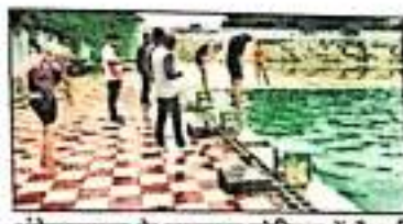
अंबेडकरनगर के एकलव्य स्टेडियम में तैराकी प्रतियोगिता में भाग लेते प्रतिभागी।