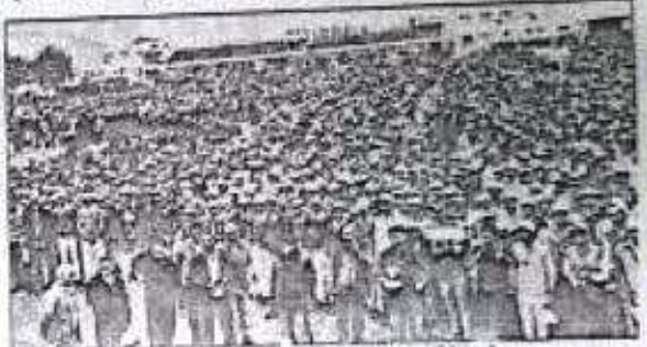
शुभराज की एकलव्य स्टेडियम में मतदाता दिवस पर शपथ लेते बच्चे