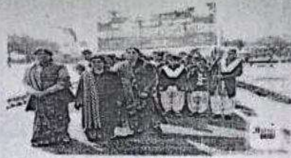
Photo Caption: शपथ लेने वाली छात्राएं