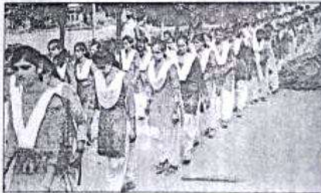
संत दारिका पीपी कॉलेज छोटीका महमदपुर में स्वच्छता जागरूकता रैली में शामिल विद्यार्थी।