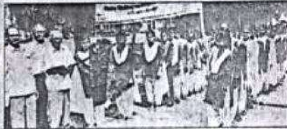
सोमवार को सन्त द्वारिका महाविद्यालय में रैली को रवाना करते प्रबंधक • डेनुमन

दशरथ वर्मा महाविद्यालय गीरा बसंतपुर कटेहरी में आयोजित राष्ट्रीय सेवा योजना के स्थापना दिवस के अवसर पर एनएसएस के छात्रों ने रैली निकाली। रैली के माध्यम से छात्रों ने गोवालपुर और गीरा बसंतपुर के गांव में ग्रामवासियों को स्वच्छता के प्रति तत्पर रहने का संदेश दिया। गांव की दीवारों पर दीवार लेखन किया। दीवार लेखन में जेरक सहाय्य लिखे गए। एक नया राबेरा लाइने-दूरे भारत को स्वच्छ बनाएँ, स्वच्छता अपनाएँ-बीमारी दूर भगाएँ, स्वच्छता अपनाएँ-