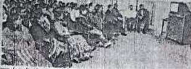
रक्षाई राजकीय महिला उच्चशिक्षण महाविद्यालय में परीक्षा पर चर्चा कार्यक्रम में प्रधानमंत्री का सजीव प्रसारण देखते शिक्षक व छात्र।