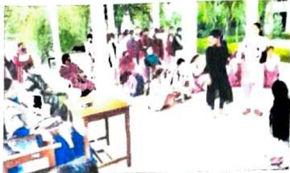
अबुधकदनगर के रक्तकर महाविद्यालय में नुकसान नटक करती छात्राएं।