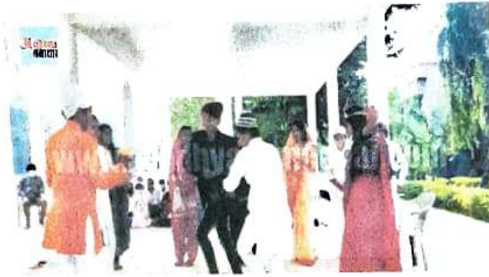
Photo Caption: नाटक में भाग लेती छात्राएं