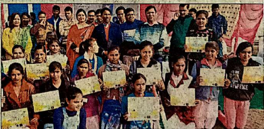
गुरुवार को एकलव्य स्टेडियम में प्रमाण पत्र के साथ खिलाड़ी