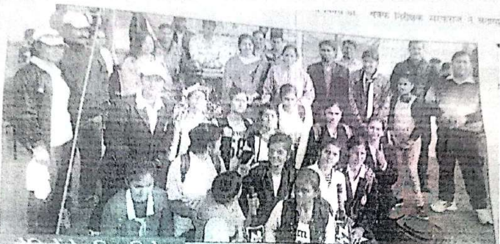
बेटियों ने महिला क्रिकेट टूर्नामेंट में दिखाया लज्जत