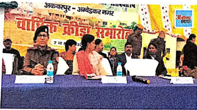
Photo Caption: कार्यक्रम में उपस्थित पुलिस अधीक्षक, प्राचार्य व अन्य