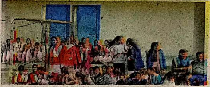
राजकीय एकलव्य स्टेडियम में क्रिकेट प्रतियोगिता का लुत्फ उठाती छात्राएं • जागरण