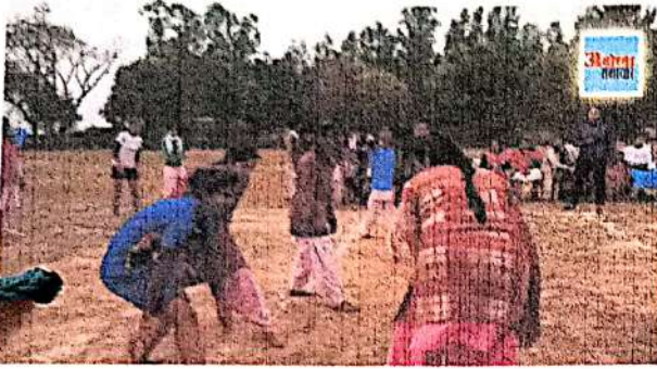
Photo Caption: कबड्डी खेलती छात्राएं