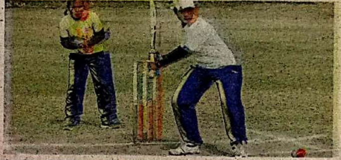
महिला क्रिकेट प्रतियोगिता के दौरान गेंद को मारने का प्रयास करती महिला खिलाड़ी